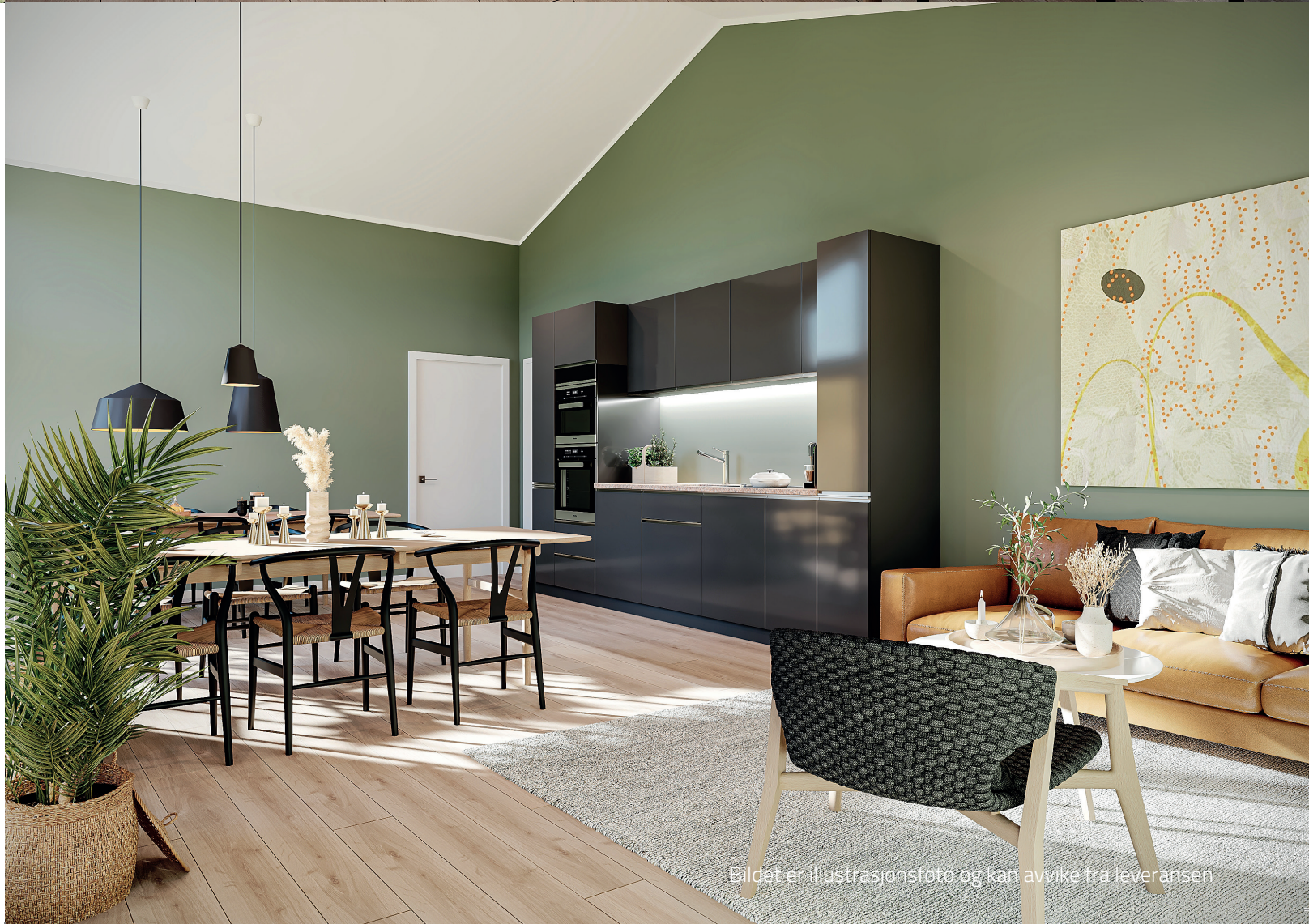
Bildet er illustrasjonsfoto og kan avvike fra leveransen