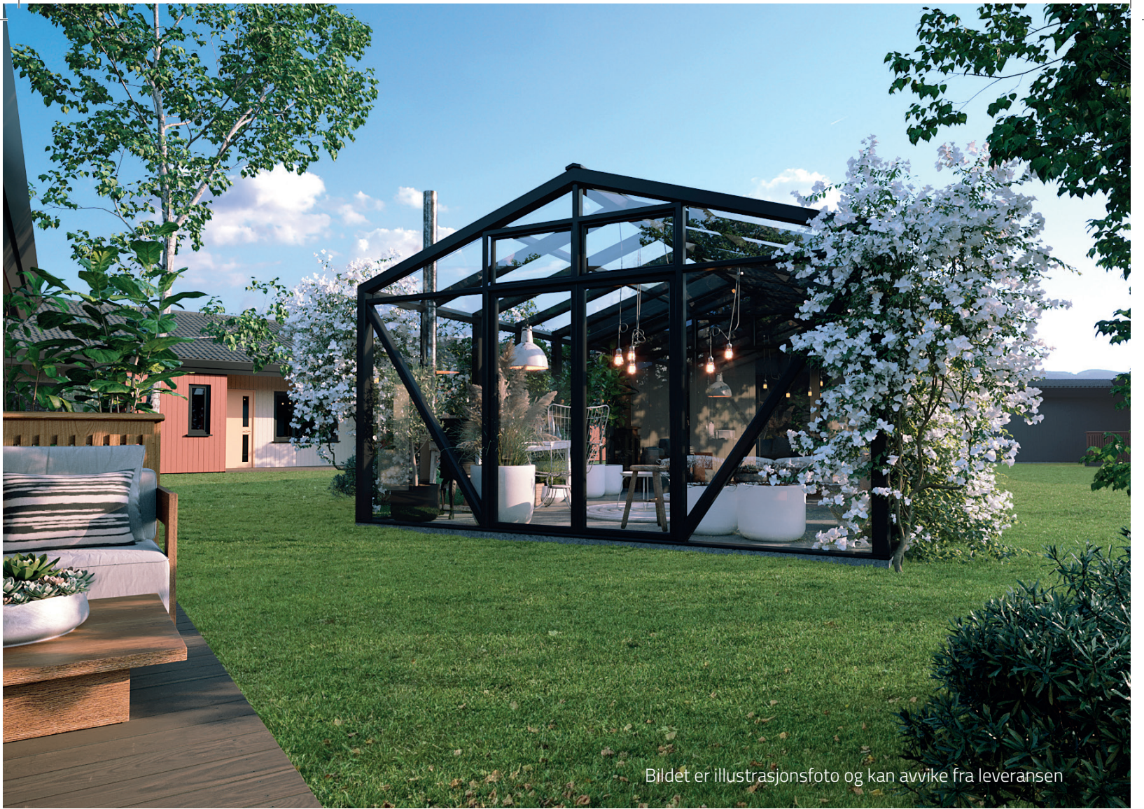
Bildet er illustrasjonsfoto og kan avvike fra leveransen