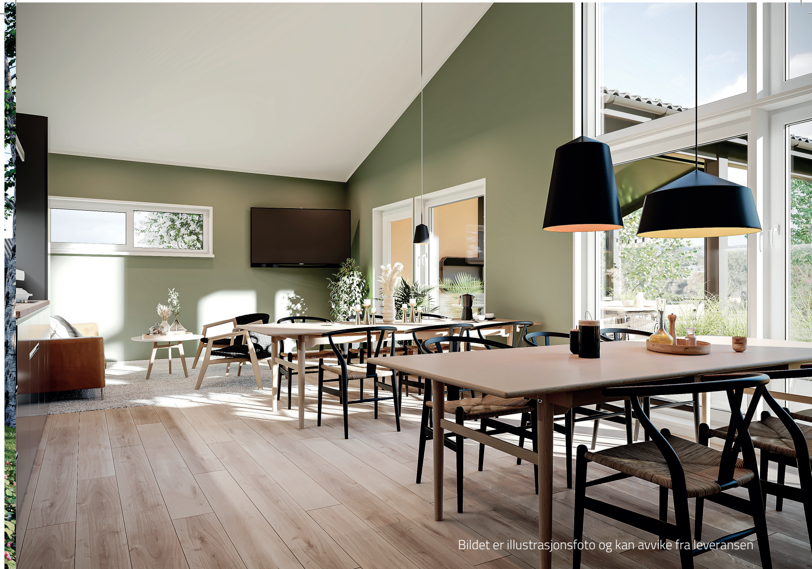
Bildet er illustrasjonsfoto og kan avvike fra leveransen